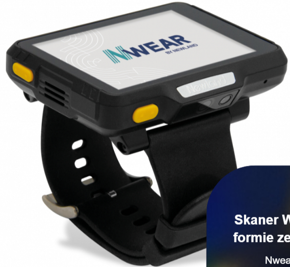
Skaner WD1 w formie zegarka