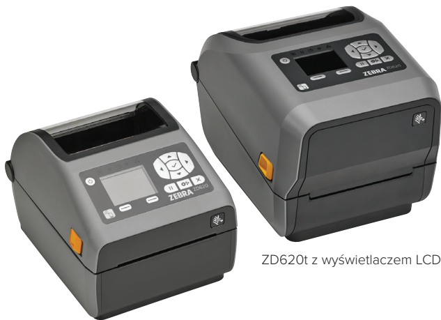
ZD620d z wyświetlaczem LCD

Kiedy istotne znaczenie ma jakość druku, produktywność, elastyczność zastosowań i prostota zarządzania, drukarka Zebra ZD620 sprawdzi się znakomicie. Należący do nowej generacji drukarek biurkowych Zebry model ZD620 zastępuje popularne drukarki z gamy GX Series oraz ZD500. Jest to coś więcej niż tylko konwencjonalna drukarka biurkowa – zapewnia ona najwyższą jakość druku i supernowoczesne funkcje. Model ZD620 jest dostępny zarówno w wersji do druku termicznego, jak i termotransferowego, a także w wersji dla służby zdrowia i doskonale sprawdzi się w wielu różnych zastosowaniach. Drukarki te wyposażone są w większość standardowych funkcji drukarek biurkowych marki Zebra oraz oferują opcjonalny 10-przyciskowy interfejs użytkownika z kolorowym wyświetlaczem LCD, dzięki któremu proces konfiguracji i odczytywania stanu drukarki nie będzie już trzeba opierać na zgadywaniu. Drukarka ZD620 działa pod systemem operacyjnym Link-OS® i jest obsługiwana przez Print DNA – nasz zaawansowany zestaw aplikacji, programów narzędziowych i narzędzi dla programistów, który zapewnia najwyższej jakości środowisko druku dzięki lepszym wynikom, prostszemu zarządzaniu zdalnemu oraz łatwiejszej integracji drukarek. Zebra ZD620 – szybkość i jakość druku oraz łatwość zarządzania drukarką niezbędne Twojemu przedsiębiorstwu do rozwijania działalności.