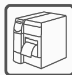
drukarki kodów kreskowych