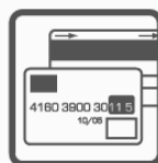
systemy akceptacji kart płatniczych