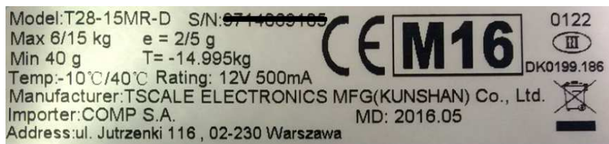
Przykładowa tabliczka znamionowa wagi T-SCALE