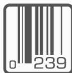
czytniki kodów kreskowych